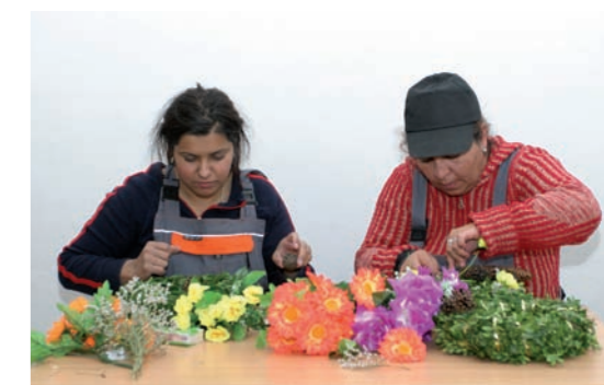
Název projektu: Zpracování ovoce a bylin ve Velké Kraši

Zpravodaj IROP Vydává Ministerstvo pro Místní rozvoj ČR, Odbor řízení operačních programů, Staroměstské náměstí 6, 110 15 Praha 1, IČ 66002222 Číslo 2, květen 2018, vychází čtvrtletně Redakce: Rostislav Mazal, Lucie Truncová, Martina Juřicová, Petr Vrba Šéfredaktor: Rostislav Mazal Grafická úprava: ISPRESS, s.r.o. Evidenční číslo: MK ČR E 22969 Kontakty: www.irop.mmr.cz, irop@mmr.cz Fotografie na titulní stránce: projekt IOP – Mléčný bar NAPROTI Příjemce: Družstvo NAPROTI