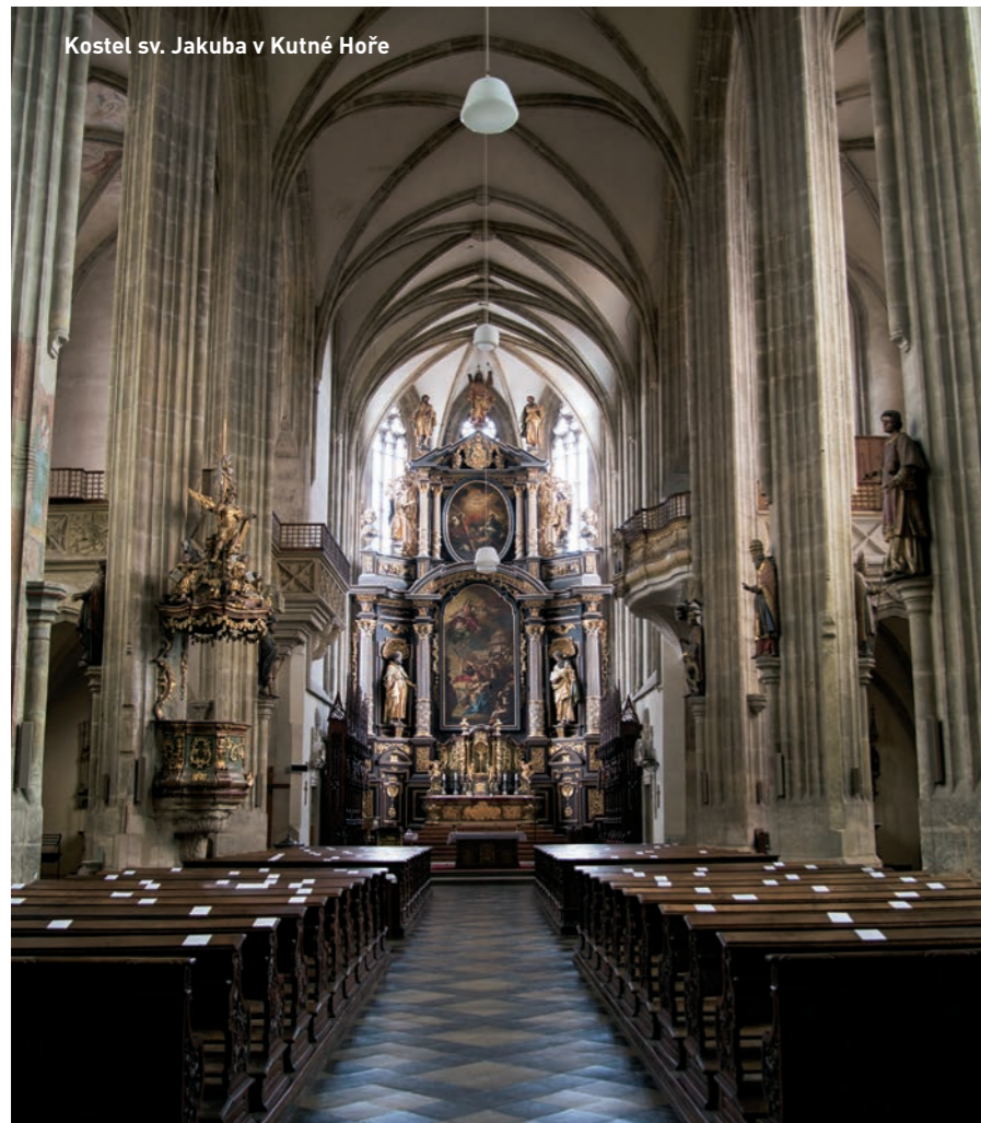
Kostel sv. Jakuba v Kutné Hoře

věkem městě se podařilo získat dotaci z IROP hned pěti památkám – žatecké radnici, synagoze a rabínskému domu, městské knihovně, tzv. Mederovu domu a Muzeu pivovarnictví Žatecka, které vznikne na místě zchátralého památkově chráněného objektu. Zajímavé také je, že se jedná o projekty různých příjemců – města, spolku, soukromé firmy či fyzické osoby podnikající.