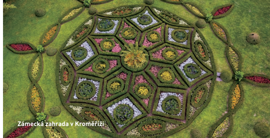
Zámecká zahrada v Kroměříži