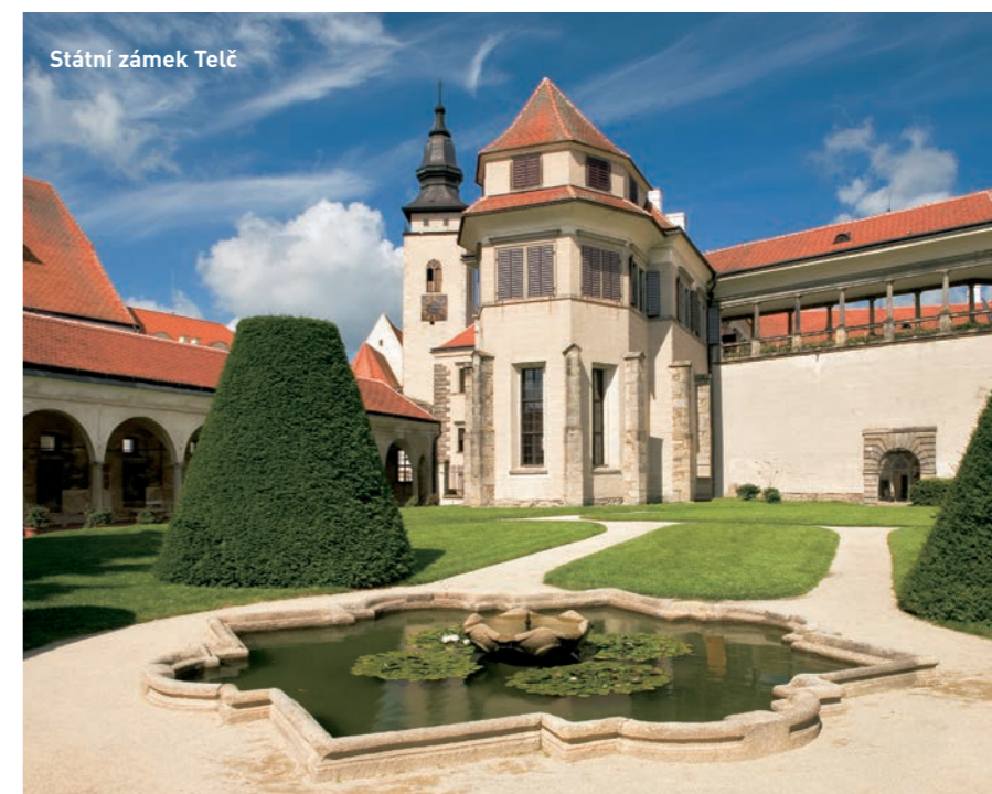
Státní zámek Telč

IROP ale nepodporuje jen velké komplexy hradů či zámků, ale také řádově menší kulturní památky. Příkladem může být kandidát do UNESCO „Žatec – město chmele“ a jeho městská památková rezervace. V tomto středo-