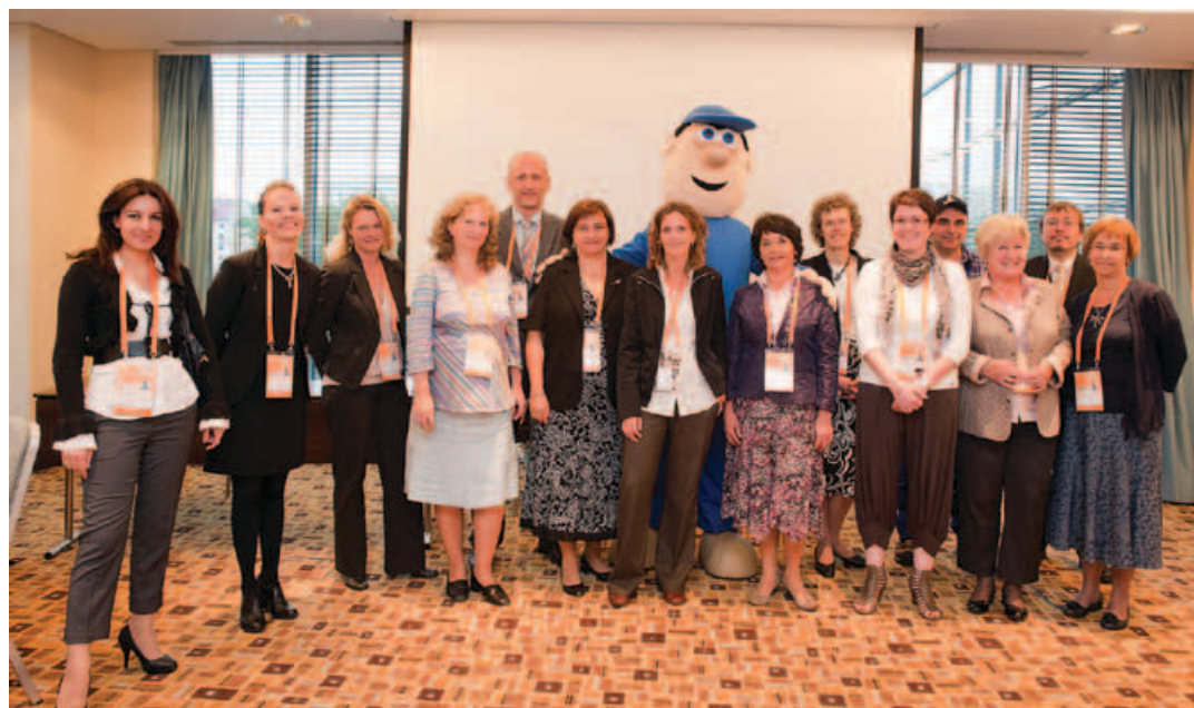
► Vedoucí jednotlivých EEN misí, autorka článku stojí uprostřed s levou rukou maskota na rameni