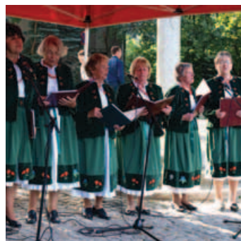
➤ Náplň kulturní vložky v podání karpaczkých dam tvořily dvě polské a česká píseň

Po cestě vlakem nás čekal přejezd do města Karpacz na polském úpatí Sněžky, kde jsme se podívali na místní projekty realizované v rámci česko-polské spolupráce: oprava náměstí a realizace pěší zóny v centru, geologická naučná stezka, nové informační centrum Krkonošského národního parku a v neposlední řadě také vystoupení místního dámského pěveckého souboru. Na závěr dne jsme navštívili sportovní ly-