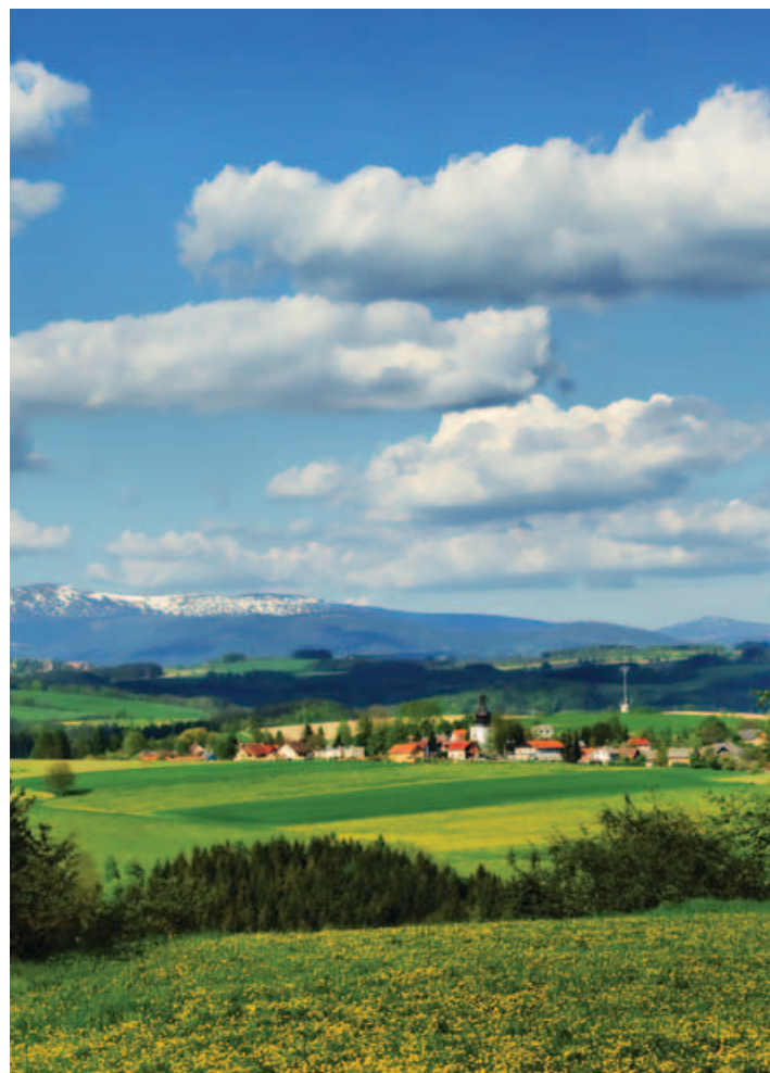
► Ilustrační fotografie