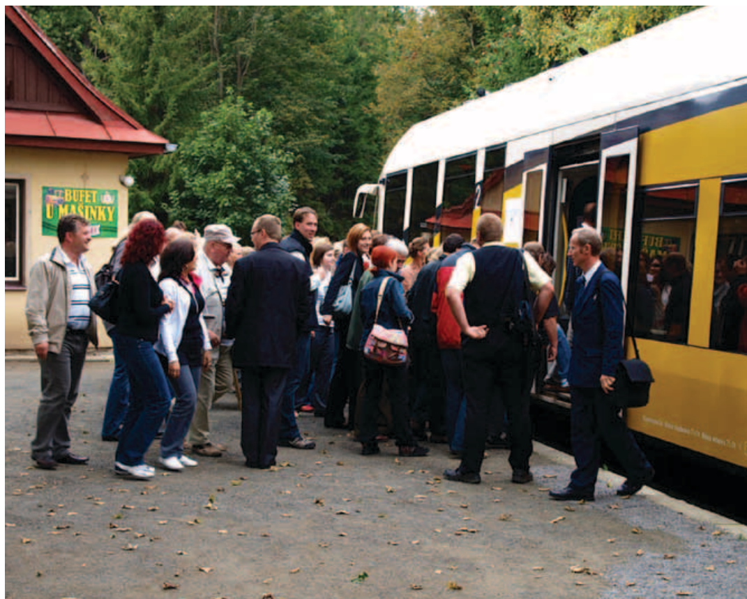
➤ Účastníci výroční akce nastupují na harrachovském nádraží do vlaku směr Polsko

V rámci výroční akce byly také představeny některé projekty realizované z tohoto programu. Jedním z hlavních bodů úterního programu byla jízda vlakem po obnovené přeshraniční trati z Harrachova do Szklarske Poreby. Provoz na této trati byl obnoven před rokem, každý den mezi oběma městy jedou čtyři páry vlaků, některé jedou na české straně až do Kořenova a na polské straně až do města Jelenia Góra.