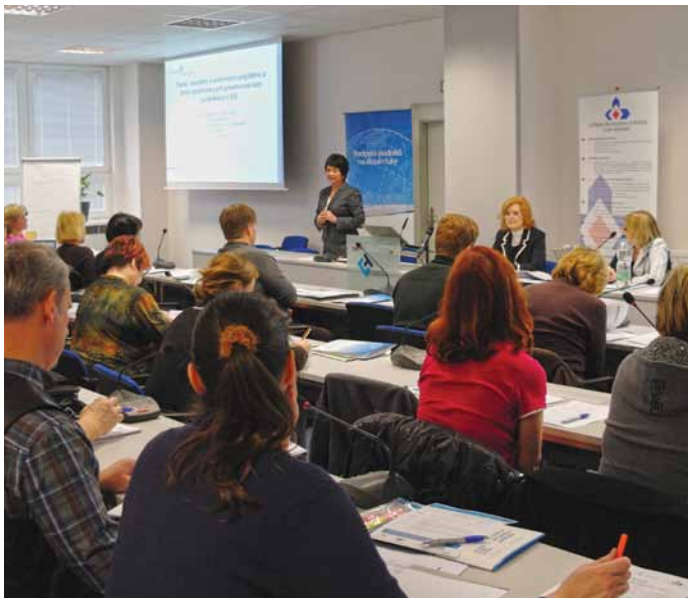
■ Seminář pro podnikatele byl opět kapacitně naplněn.