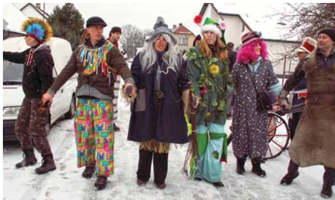
▣ Jednou ze společenských akcí v Řepici je i masopust.

V červenci byly také vyhlášeny výsledky dvanáctého ročníku Evropské ceny obnovy vesnice, která se koná vždy jednou za dva roky. Mezi 29 účastníků z dvanácti zemí byli i dva poslední vítězové naší Vesnice roku. Ratměřice (vítěz 2010) byly nejmenší ze zúčastněných obcí, ale oslovily porotu širokým a aktivním zapojením obyvatel do rozvoje obce a vytvořením dobrých životních podmínek natolik, že postoupily do dvanáctičlenného finále. Celkovým vítězem se nakonec stal švýcarský Vals.