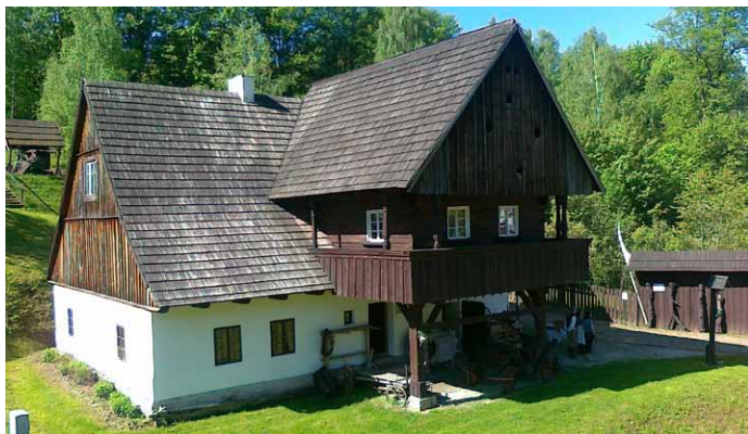
■ Dominantou skanzenu ve Stroužném je budova zájezdního hostince