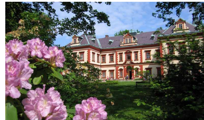
■ Chloubou Jilemnice je tamní renesanční zámek