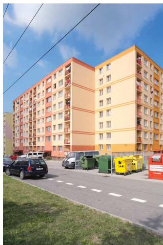
▣ Revitalizace sídliště v Havířově (autor: Ing. Jiří Šlemar)