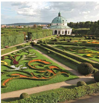
■ Jedním z hlavních turistických cílů střední Moravy je kroměřížský zámek a přílehlé zahrady, zapsané na seznamu památek UNESCO

Nestátní subjekty se mohou o dotaci ucházet výhradně v aktivitě