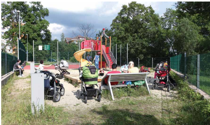
■ Mezi šesti zpracovanými Integrovanými plány rozvoje území je i liberecko-jablonecká aglomerace. Obě města již mají zkušenost s realizací IPRM, jak ukazuje snímek z libereckého sídliště Rochlice

CRR se na administraci včas připravilo a sestavilo speciální šestičlenný tým na pobočce Praha, který byl určen pouze na tuto výzvu. Současně byl metodicky ošetřen účinný mechanismus administrace a komunikace s příjemci. Naši prioritou bylo příjemcům maximálně ulehčit administraci projektů a zajistit co nejlhůdší průběh výzvy. Byl zpracován, zveřejněn a pravidelně aktualizován přehled často kladených dotazů. I přes značné množství jednotlivých příjemců se podařilo udržet se všemi aktivní kontakt a jednotliví pracovníci znají své příjemce. Zároveň ale byla zajištěna plnohodnotná zastupitelnost jednotlivých administrátorů na straně CRR. Také jsme příjemcům připravili podrobný metodický návod, jak vyplnit závěrečnou monitorovací zprávu, aby se předložilo vracení dokladů a urychlila se administrace. Přesto její průběh úplně bezproblémový nebyl. V rámci přípravy na očekávané předložení 178