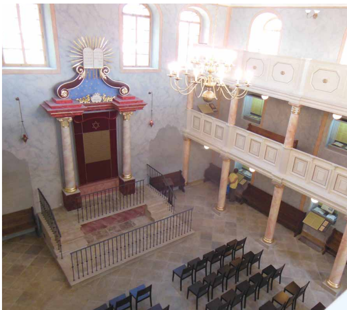
▣ Součástí projektu 10 hvězd byla i rekonstrukce brandýšské synagogy a svatostánku aron ha-kodes (autor: Ing. Adéla Brožová)

Ke svému konci se blíží i projekt Národní centrum zahradní kultury v Kroměříži. Ten se skládá z úprav interiérů a vstupní expozice Arcibiskupského zámku, z rekonstrukce zahradnictví Podzámecké zahrady jako technického zázemí pro údržbu a z obnovy Květné zahrady. Výsledky projektu jsou zacíleny hned čtyřmi směry. Prvním směrem je tvorba metodik a poradenství pro majitele a správce historických za-