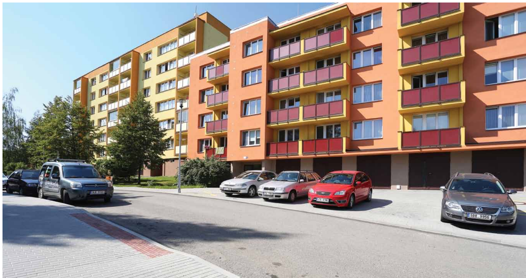
■ Mezi městy realizujícími IPRM byl také Nový Jičín (autor: Ing. Jiří Šlemar)

mezit vzniku takzvaných sociálních ghatt na sídlišťích s vyšší koncentrací těchto skupin. IPRM jsou rozděleny do tří dílčích aktivit. Projekty na revitalizaci veřejných prostranství zahrnují výsadbu a obnovu veřejné zeleně, obnovu městského mobiliáře, výstavbu a rekonstrukci chodníků a cyklistických stezek, realizaci technické infrastruktury nebo budování rekreačních ploch a dětských hřišť. Oprávněnými žadateli pro tyto projekty jsou pouze města, která mohou získat z evropských fondů podporu ve výši 85 procent nákladů projektu. Projekty na regeneraci bytových domů zahrnují zateplení domů, opravy nosných konstrukcí, sanaci základů, rekonstrukci technického vybavení domů, modernizaci lodžii a balkonů a zajištění moderního sociálního bydlení při renovacích stávajících budov. Dotace byla určena pro vlastníky bytových domů – města, bytová družstva, společenství vlastníků jednotek a další majitele z řad právnických i fyzických osob. Výše dotace byla