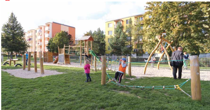
■ Opravené domy a nové dětské hřiště v Třebíči (autor: Ing. Jiří Šlemar)

Prvním významným krokem na cestě ke skutečné regionální politice bylo založení Ministerstva pro místní rozvoj v roce 1996 a jeho příspěvkové organizace Centra pro regionální rozvoj o rok později. V roce 1998 vláda přijala aktualizaci Zásad regionální politiky, které poprvé hovoří o nutnosti koncepční činnosti státu