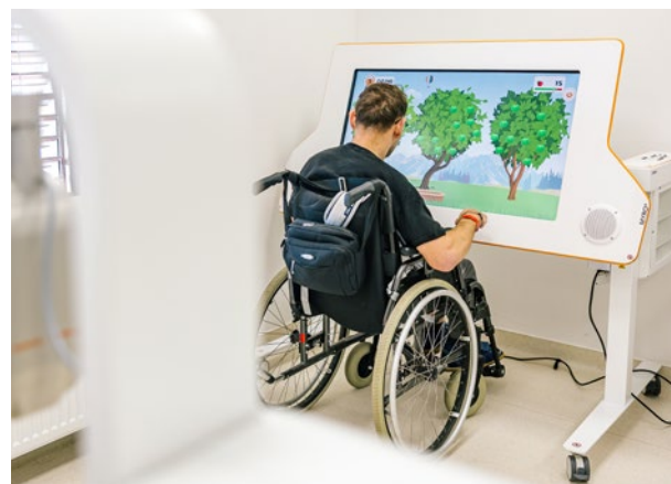
Centrum komplexní rehabilitace, Lázně Bělohrad ▼