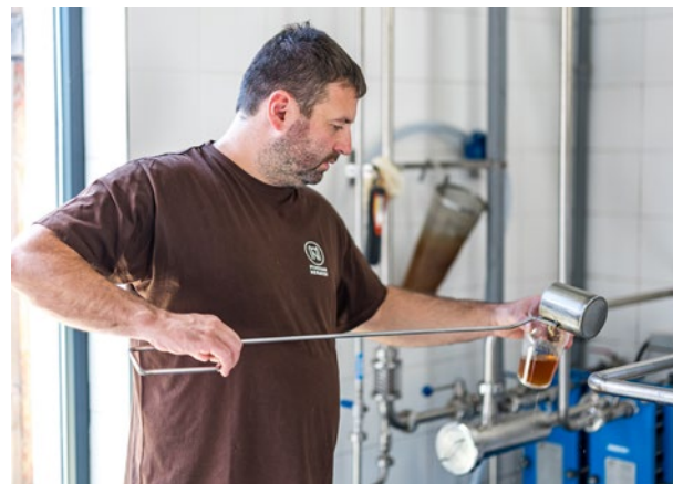
Poutní pivovar v Neratově ▲

I nadále chceme být lídrem v administraci projektů financovaných z fondů EU i dalších národních dotačních programů. Dokážeme pružně reagovat na resortní potřeby (a veřejný zájem obecně) a disponujeme vysokou mírou metodické autority. Naší vizí je fungovat jako efektivní a respektovaná agentura, která má na území České republiky na starost veřejné politiky podporující regionální rozvoj, soudržnost a konkurenceschopnost.