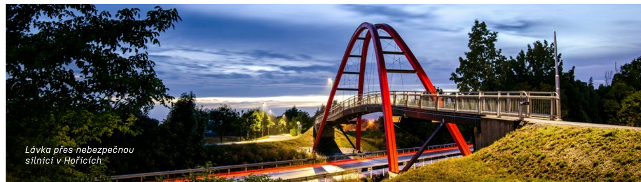
Lávka přes nebezpečnou silnici v Hořicích