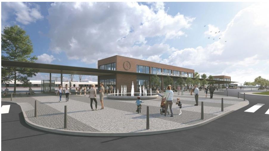
Centrální dopravní terminál Jihlava - IROP